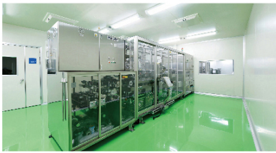
■ 外観目視検査ライン