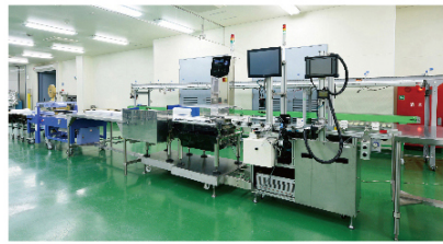
■ 高薬理活性対応包装作業室