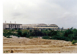
コートジボワール-SOTEXI