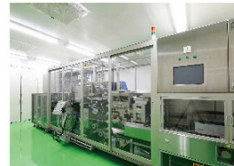
検品包装(検品包装新ライン2015年12月稼働開始)